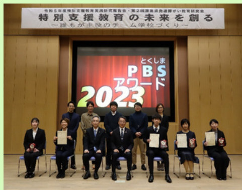
令和5年度とくしまPBSアワード表彰式

後日、総合教育センターHPにも公開しますので、オリジナリティあふれる実践事例を各園・校の取組の参考にしてください。