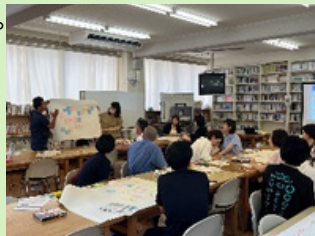
徳島市PBSワーキング研修会の様子